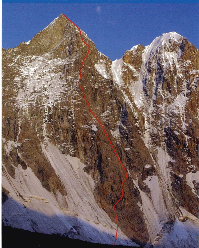
La nova via Guilleries solca la cara oest d'aquest afilat cim del massís de Rakaposhi.